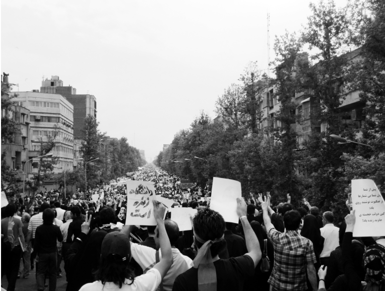
„The University is alive“, Tehran, 2009, Faeghe Kordestani

kuratiert von Lorenza Kaib in Zusammenarbeit mit Elke Seeger & Larissa Zauser